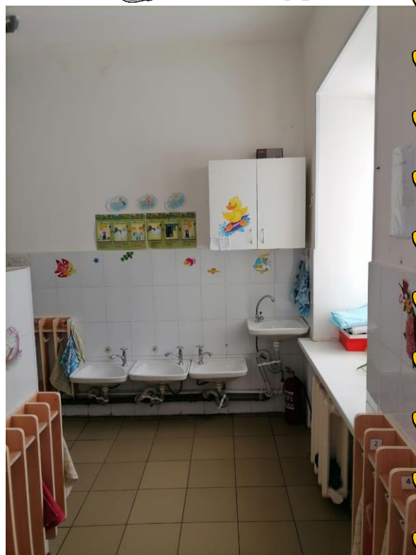
Предметно – пространственная среда в группе